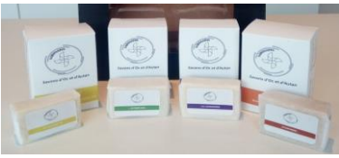
SAVONS INVITES; emballage papier de soie fabriqué à Engomer (09)