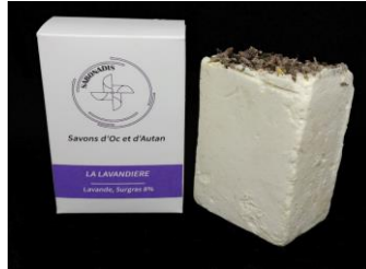
LAVANDIERE: Huiles olive/colza/tournesol; Huile Essentielle Lavande classique bio