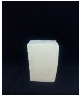
SAVON DE VAISSELLE: Huiles olive/tournesol; Bicarbonate de soude; HE romarin verbénone