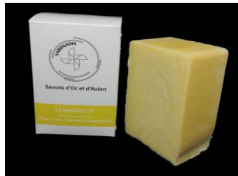
SABONETTE: Huiles olive/colza/tournesol; Neutre