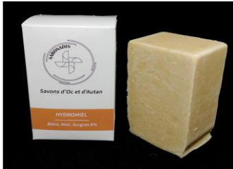
HYDROMIEL: 100% Huile d'olive; Bière; Miel