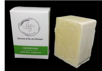
INTEMPOREL: 100% Huile d'olive; Neutre